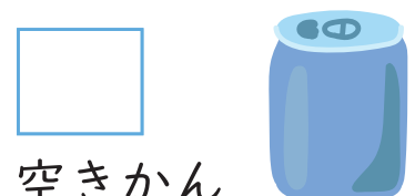
空きかん (アルミニウム)