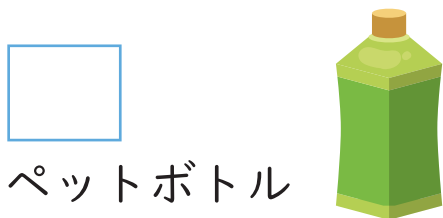
ペットボトル (プラスチック)