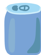
空きかん (アルミニウム)