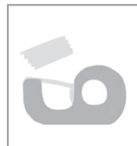
セロハンテープ 333 円