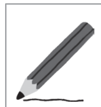
えんぴつ 85 円