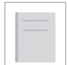
ノート 130 円