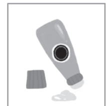
のり 210 円